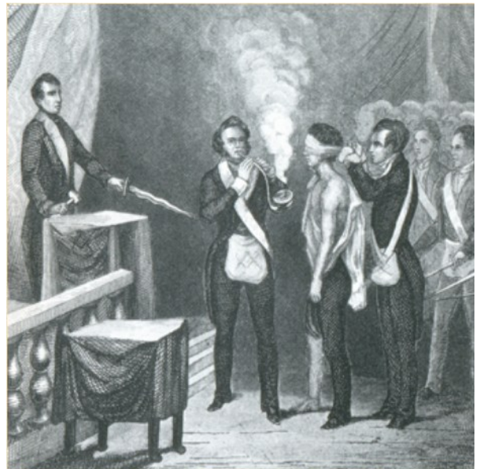
Escena de la retirada de la venda y de la visión de la luz mediante lycopodio según dibujo de Johann Georg Beck, 1848

El mito de la iniciación , que apareció mucho antes del periodo judeocristiano, utiliza la violencia como condición de acceso a la iniciación.